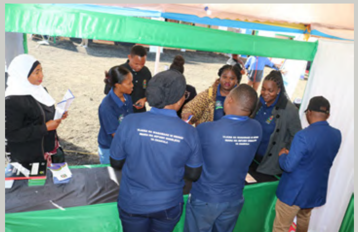
Watumishi wa Tume ya Utumishi wa Walimu (TSC) wakihudumia wateja waliotembelea banda la TSC kwenye Maonesho ya Wakulima Nanenane yaliyofanyika Agosti 1 – 8, 2023 katika Viwanja vya John Mwakangale jijini Mbeya.