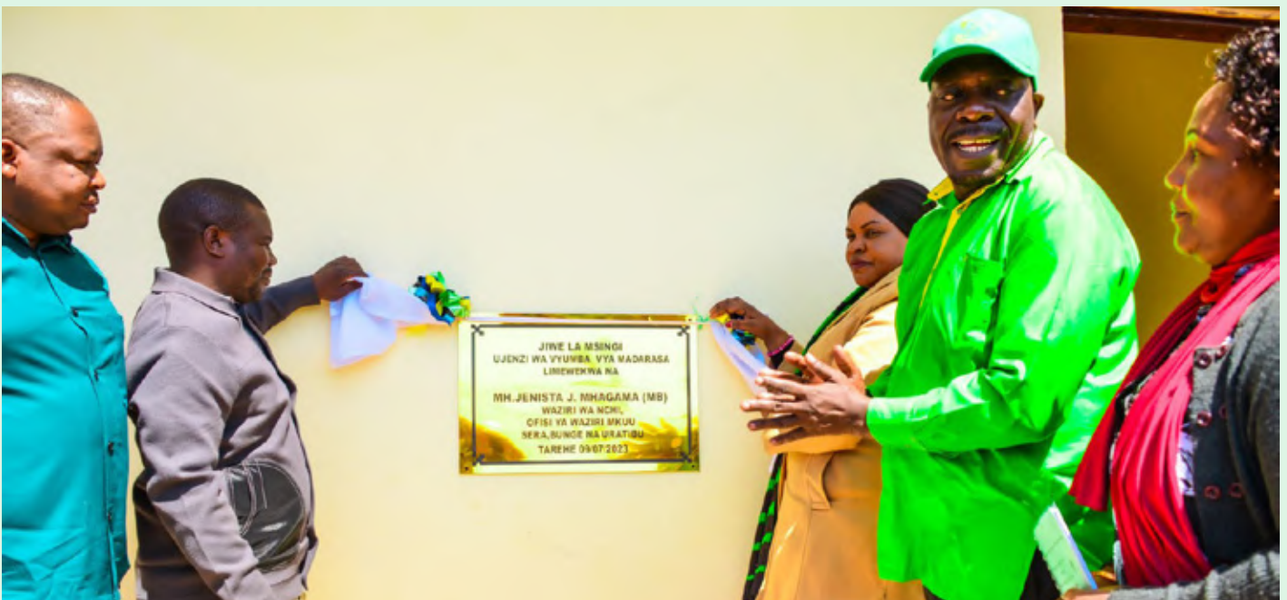
Waziri wa Nchi Ofisi ya Waziri Mkuu (Sera Bunge na Uratibu) Mhe. Jenista Mhagama (Mb) Peramiho akizweka jiwe la Msingi Katika shule ya Msingi Muungano iliyopo katika kijiji cha Namatuhi kata ya Ndongosi.