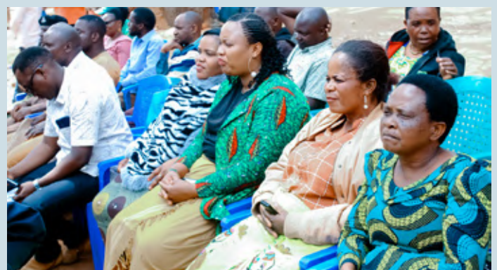
Baadhi ya Madirivani wa viti Maalum wa CCM wa Kata ya Kibakwe wakimsikiliza Waziri wa Nchi, Ofisi ya Rais Menejimenti ya Utumishi wa Umma na Utawala Bora Mbunge wa Kibakwe ambaye pia Mbunge wa Jimbo la Kibakwe, Mhe. George Simbachawene wakati wa mkutano wa hadhara katika Jimbo la Kibakwe.