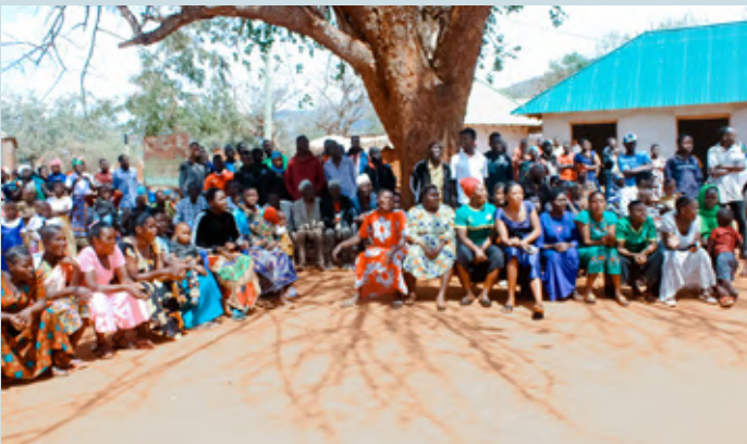
Sehemu ya wananchi wa Kata ya Lumuma wakimsikiliza Waziri wa Nchi, Ofisi ya Rais Menejimenti ya Utumishi wa Umma na Utawala Bora Mbunge wa Kibakwe ambaye pia Mbunge wa Jimbo la Kibakwe, Mhe. George Simbachawene wakati wa mkutano wa hadhara katika Jimbo la Kibakwe.