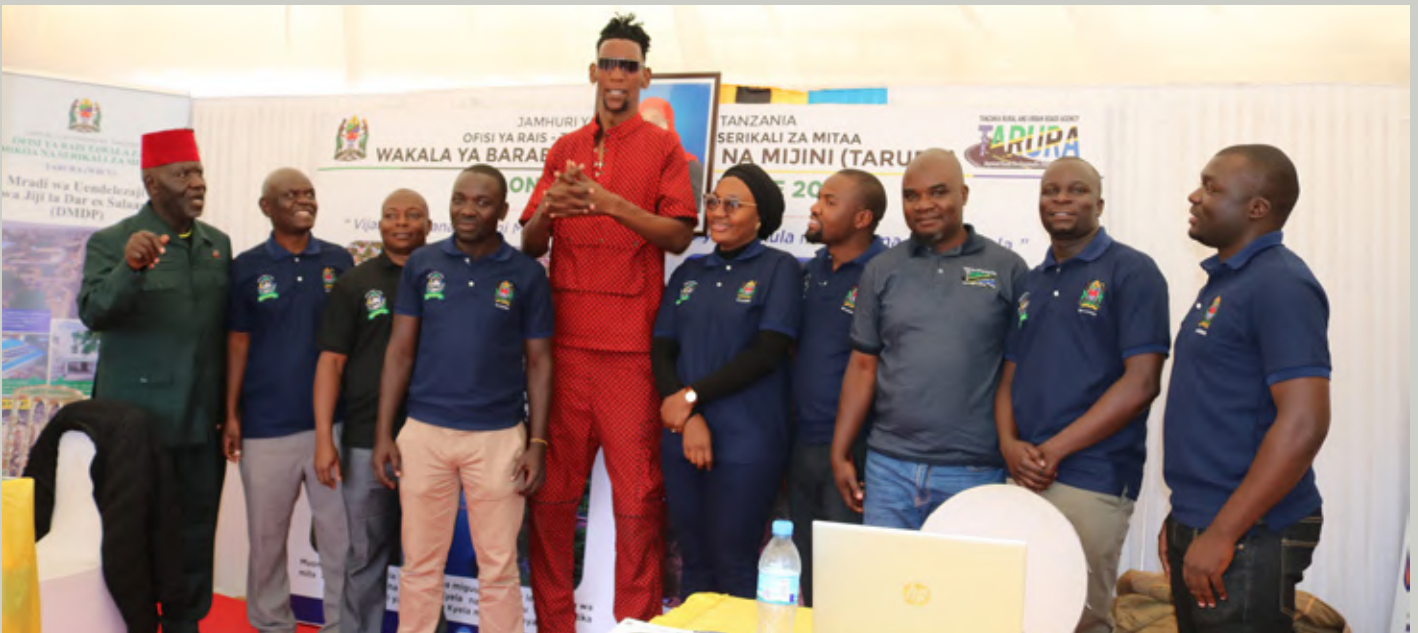
Watumishi wa Ofisi ya Rais – TAMISEMI na Taasisi zake walioshiriki maonesho ya Nanenane mkoani Mbeya wakiwa aktika picha ya pamoja na wateja waliotembelea mabanda ya TAMISEMI.