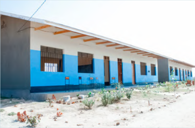
Baadhi ya muonekano wa majengo ya shule ya Sekondari Lumuma Green ambayo imejengwa kwa nguvu za wananchi wa Kata ya Lumuma katika Jimbo la Kibakwe mkoani Dodoma ambapo amewapongeza wananchi hao kwa kazi kubwa waliyofanya.