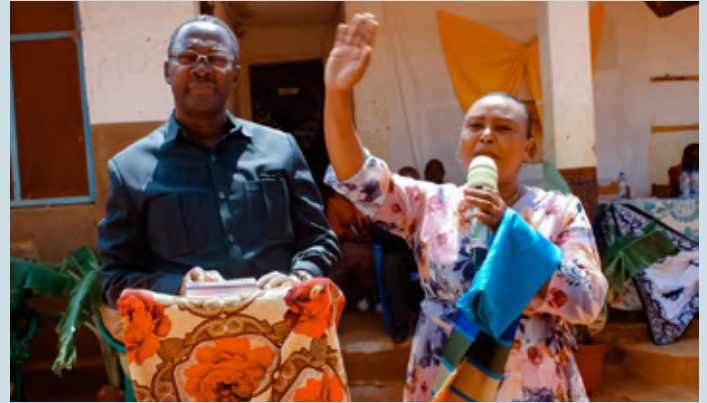
Waziri wa Nchi, Ofisi ya Rais Menejimenti ya Utumishi wa Umma na Utawala Bora ambaye pia ni Mbunge wa Jimbo la Kibakwe, Mhe. George Simbachawene akimtambulisha mke wake wakati mkutano wa hadhara katika Kata ya Lumuma.