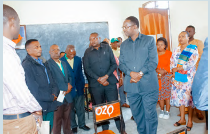
Waziri wa Nchi, Ofisi ya Rais Menejimenti ya Utumishi wa Umma na Utawala Bora ambaye pia ni Mbunge wa Jimbo la Kibakwe, Mhe. George Simbachawene akizungumza na Walimu wa Shule ya Sekondari Lumuma Green ambayo imejengwa kwa nguvu za wananchi wa Kata ya Lumuma katika Jimbo la Kibakwe mkoani Dodoma kabla ya mkutano wa hadhara.