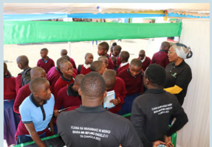
Wanafunzi wakipata maelezo katika banda la Tume ya Utumishi wa Walimu (TSC) tarehe 5 Agosti, 2023 katika maonesho ya Nanenane yaliyofanyika katika Viwanja vya John Mwakangale jijini Mbeya.